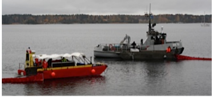
Sjövärnskåren lägger ut oljeläns tillsammans med Sjöräddningen.